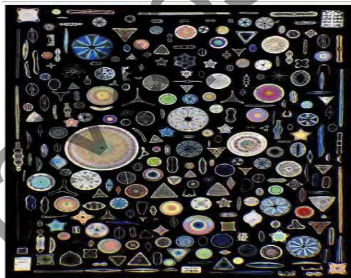
شکل ۲. انواع مختلف دیاتوم ها بر اساس شکل و ساختار

دیاتوم ها جلبک های فنوسنتز کننده، بویکاریوت، تک سلولی هستند که تقریباً در هر زیستگاه آبی روی سطح زمین وجود دارند. جدا از اهمیت اکولوژیکی آنها، به دلیل دیواره سلولی حاوی سیلیس بسیار شناخته شده هستند. دیواره های سلولی آنها دارای مقیاس نانومتر تا میکرومتر است. دیاتوم ها از مواد آلی و معدنی تشکیل شده اند که حدود 97\% دیواره سلولی دیاتوم ها از ترکیبات معدنی به خصوص سیلیس هیدراته خالص با مقدار کمی آلومینیم و آهن تشکیل شده است (شکل ۲). این ترکیبات به دلیل داشتن سطح ویژه بالا به خاطر نانوسیلیس قادر به جذب انواع آلاینده ها به خصوص مواد فرار مثل گازها هستند [۸].